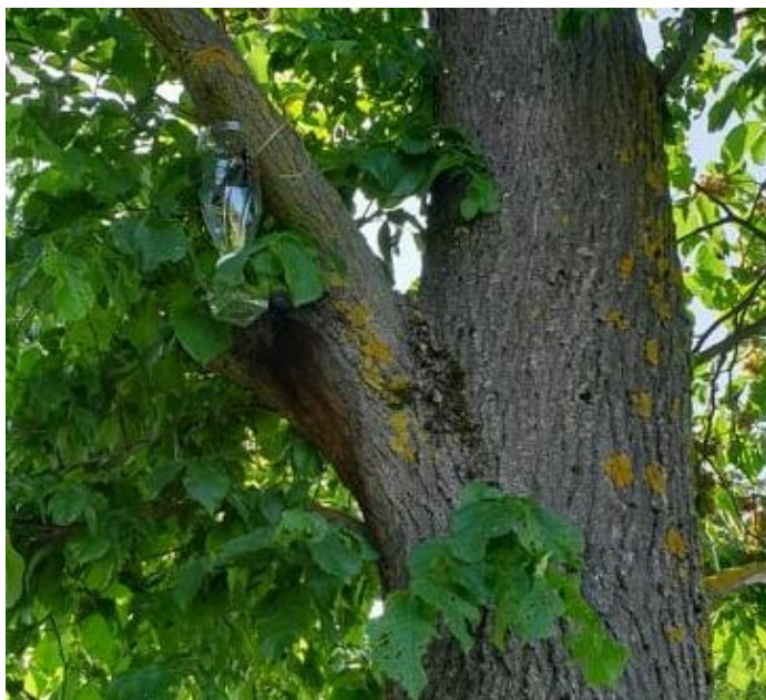
Joonis 3. Püünis puu külge seotuna